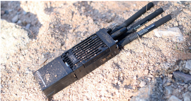
IP 68, MIL-STD-810G

Das MPU5 ist eine hocheffiziente Mobile-Ad-Hoc-Networking-Funklösung zur Funk-/Datenübertragung. Es erstellt überall leistungsstarke, sichere Netzwerke und vereint verschiedene Datenquellen in Echtzeit. Das Grundgerät (Chassis) enthält einen kleinen Rechner mit einem 1GHz-Quad-Core-ARM-Prozessor und einem Android®5-Betriebssystem.