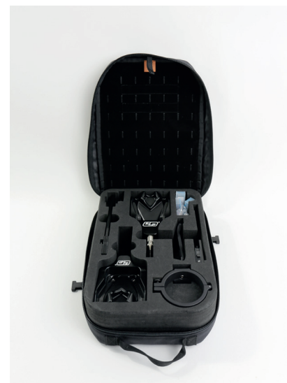
SOFTBAG MIT HARTSCHAUMEINLAGE